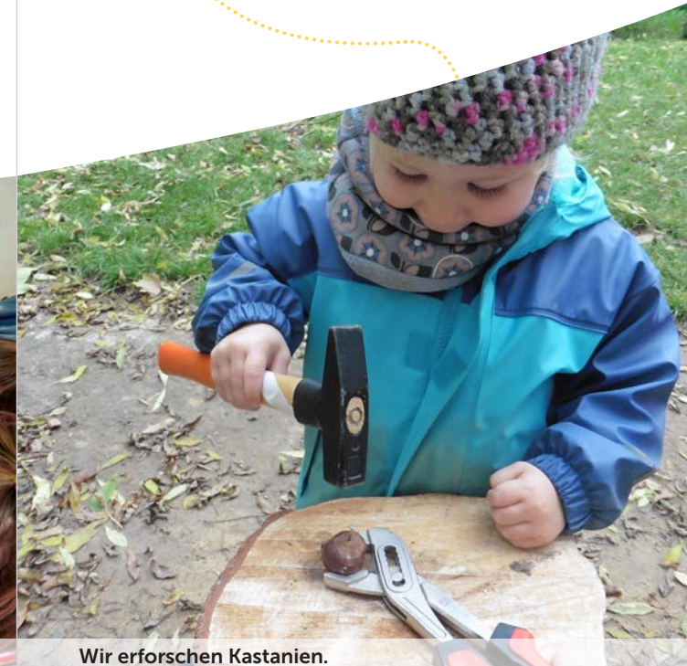
Wir erforschen Kastanien.