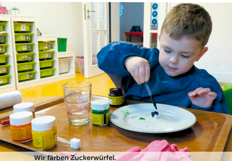
Wir färben Zuckerwürfel.