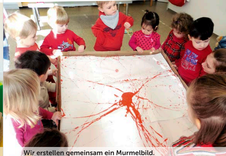
Wir erstellen gemeinsam ein Murrelbild.