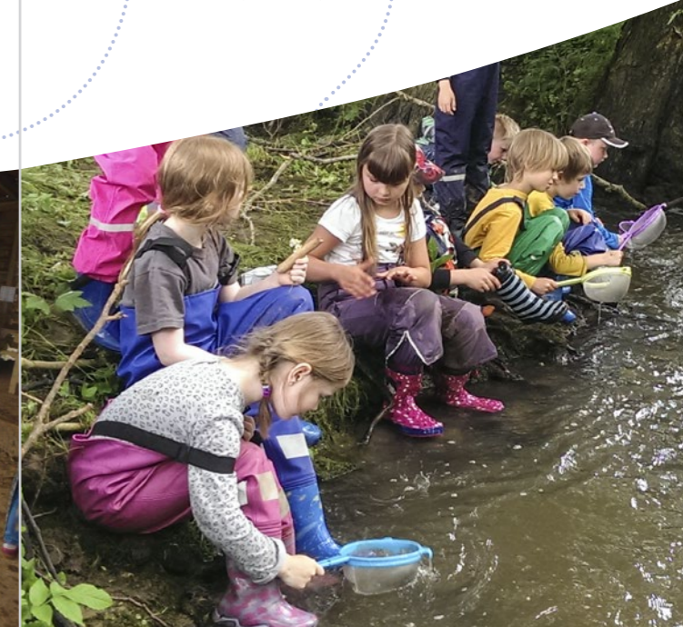
Nachmittags-Angebot – Expedition in den Forscherwald

Die Nachmittagsangebote und auch die Ferienspiele werden von unseren pädagogischen Fachkräften aus dem Vormittag durchgeführt.