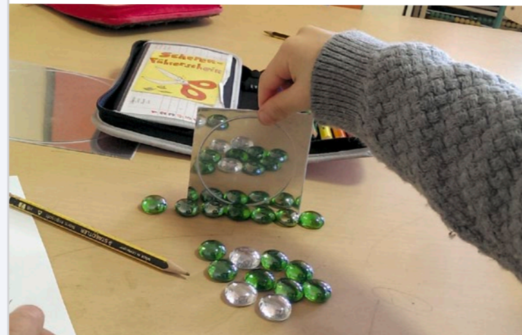
Ausprobieren und Entdecken – wir lernen verdoppeln

Mit einer zusätzlichen, pädagogischen Fachkraft in jeder Klasse hat unsere Schule mit ca. 11:1 einen besseren Betreuungsschlüssel als viele andere Schulen. Dies ermöglicht eine bessere Förderung und Forderung individueller Begabungen und Fähigkeiten der Schülerinnen und Schüler.