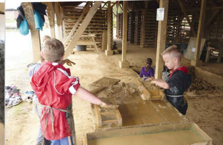
Praktisches Lernen – Exkursion zur Ziegelei in Lage

Unseren Schulalltag bereichern unsere Schulhunde. Tiergestützte Pädagogik setzen wir u.a. zur Förderung des Verantwortungsgefühls und des Selbstbewusstseins ein.